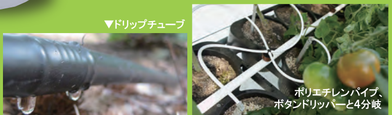
▼ドリップチューブ